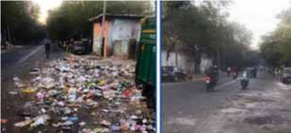
विनोद नगर वार्ड