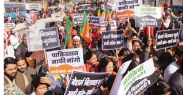
भाषा। नई दिल्ली

प्रधानमंत्री नरेंद्र मोदी पर असभ्य और अप्रिय व्यक्तिगत हमला करने को लेकर भारतीय जनता पार्टी (भाजपा) ने शनिवार को पाकिस्तान के विदेश मंत्री बिलावल भुट्टो के खिलाफ राष्ट्रव्यापी प्रदर्शन किया।