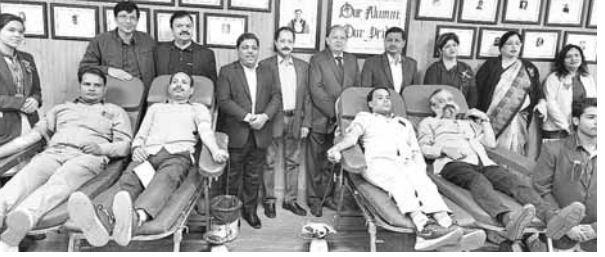
सेक्टर 14 स्थित डीएवी पब्लिक स्कूल में आयोजित शिविर में रक्तदान करते समाजसेवी