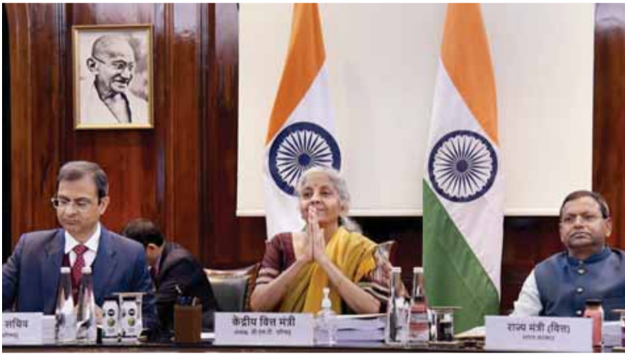
एसयूवी (स्पोर्ट्स यूटिलिटी व्हीकल) की परिभाषा को भी स्पष्ट करते हुए इन वाहनों पर 22 प्रतिशत मुआवजा उपकर लगाने का फैसला किया।

जीएसटी परिषद ने नियमों के अनुपालन में की जा रही कुछ गड़बड़ियों को अपराध की श्रेणी से बाहर रखने पर शनिवार को सहमति जताई। इसके साथ ही अभियोजन शुरू करने की सीमा को दोगुना कर दो करोड़ रुपये करने और नकली चलान के लिए एक करोड़ रुपये की सीमा बरकरार रखने का फैसला किया गया। परिषद ने अपनी 48वीं बैठक में