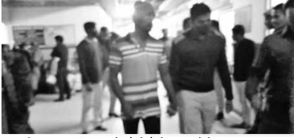
बिना अल्ट्रासाउंड करवाये लौटने कैदी व अन्य रोगी

अल्ट्रासाउंड करवाने आए कैदी, रोगी व गर्भवती महिलाओं को भीड़। पॉइंट ने बताया कि वे यहां 13 दिसंबर से अल्ट्रासाउंड कर रहे हैं। इस विषय में अस्पताल प्रबंधन ने बताया कि एनएचएम योजना के तहत अल्ट्रासाउंड को रखा गया है। जिसमें उन्हें गर्भवती महिलाओं के अल्ट्रासाउंड करने के लिए कहा गया है। उनका रजिस्ट्रेशन सीएमओ द्वारा करवा दिया गया है। उन्हें प्रति अल्ट्रासाउंड के 330 रुपये दिए जाएंगे। अल्ट्रासाउंड के आने से