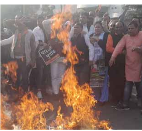
नोएडा में बिलावल भुट्टे का पुतला फूँकते भाजपा कार्यकर्ता।

गाजियाबाद में कार से पालतू कुत्ते को कुचलने का मामला सामने आया है। 2 पालतू कुत्ते सोसाइटी के अंदर खेल रहे थे और इस दौरान कार ने एक को कुचल डाला। इस हादसे में उसकी मौत हो गई। सोशल मीडिया पर ये वीडियो टीला मोड़ इलाके भारत सिटी की बताई गई है। एनिमल पर काम करने वाली संस्था बीगा धूमन के टिक्टोर हैंडल से इस वीडियो को शेयर किया गया है। 8 सेकेंड को इस वीडियो में सोसाइटी के अंदर 2 पालतू कुत्ते सड़क पर खेल रहे थे। इस दौरान 1 स्विफ्ट कार मुड़ी और उसने एक छोटे पालतू कुत्ते को कुचल दिया। ट्वीट के अनुसार, यहां रहने वाले कुछ लोग पिछले कुछ दिनों से विभिन्न तरीकों से कुत्तों को चोट पहुंचाने की योजना बना रहे थे, जिसका नतीजा ये हादसा है। वीडियो जब की है, अभी इस बारे में कुछ पता नहीं चल पाया है। फिलहाल इस वीडियो के सामने आने के बाद ड्राग लवर्स अब आरोपी कार चालक पर कठोर कार्रवाई की मांग कर रहे हैं।