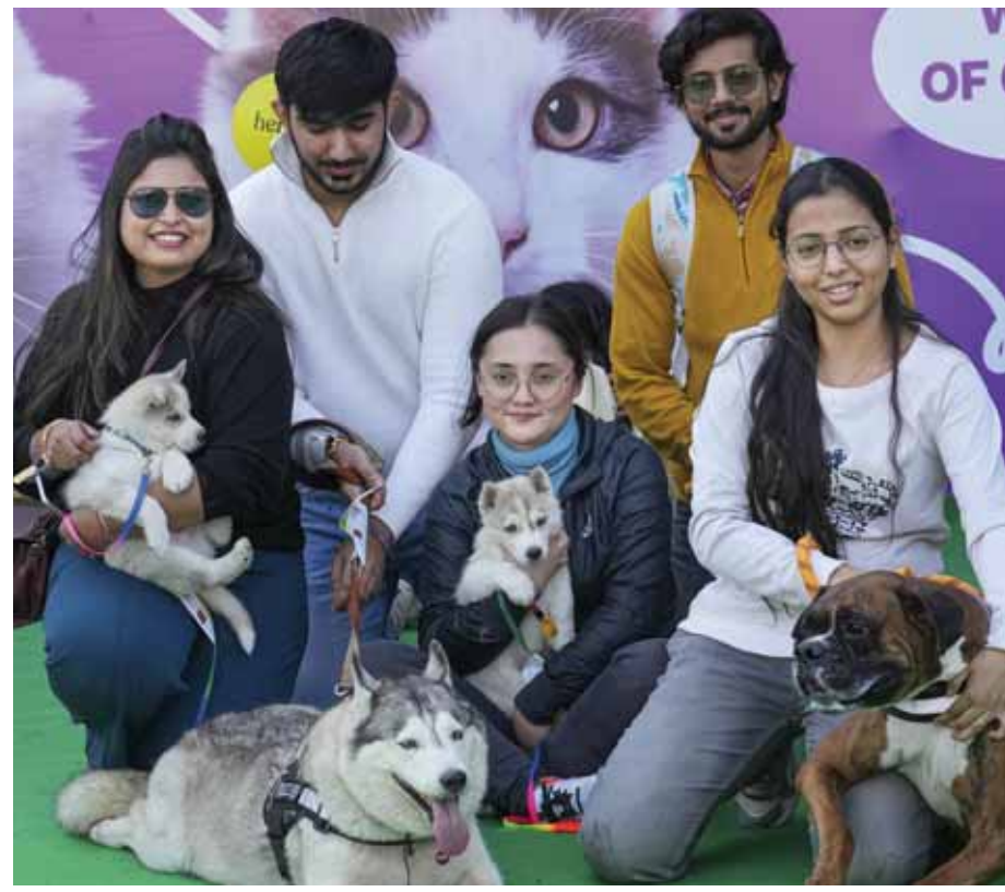
राजधानी के ओखला में आयोजित मेले में पालतु जानवरों के साथ पहुंचे पशु प्रेमी।