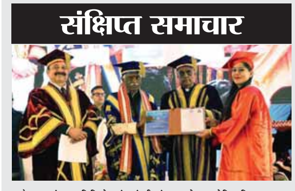
कें.आर. मंगलम विवि के पांचवां दीक्षांत समारोह आयोजित किया गया। हरियाणा के राज्यपाल बंडूक दात्रेय ने छात्रों को डिग्री प्रदान की।

कें.आर. मंगलम विवि के पांचवां दीक्षांत समारोह आयोजित किया गया। हरियाणा के राज्यपाल बंडूक दात्रेय ने छात्रों को डिग्री प्रदान की। टाटा पावर डिस्ट्रीब्यूशन की लोक अदालत आज नई दिल्ली। बिजली सप्लाई करने वाली पावर यूटिलिटी टाटा पावर दिल्ली डिस्ट्रीब्यूशन लिमिटेड ने दिल्ली स्टेट लोगल सर्विसेज अथॉरिटी (डीएसएलएस) के सहयोग से आज एक स्पेशल लोक अदालत लगाई जाएगी। इस लोक अदालत में ऐसे मामलों पर विचार किया जाएगा जो किसी भी अदालत में पेंडिंग हैं या जिन्हें अभी तक किसी अदालत में दाखिल नहीं किया गया है। बिजली चोरी के मामलों के निपटारे के इच्छुक ग्राहक व्यक्तिगत रूप से या अपने अधिकृत प्रतिनिधि के जरिए (अर्थॉरिटी लैटर के साथ) लोक अदालत में भाग ले सकते हैं। बिजली चोरी के मामलों का निपटारा करने के इच्छुक उपभोक्ता इस अवसर का लाभ उठाकर अपने लंबित मामलों का तत्काल और संतोषजनक तरीके से निपटारा करवा सकते हैं। ग्राहकों के स्तर पर डिफॉल्ट होने की स्थिति में, कंपनी विद्युत अधिनियम, 2003 के प्रावधानों के अनुरूप आवश्यक आपराधिक कार्यवाही कर सकती है।