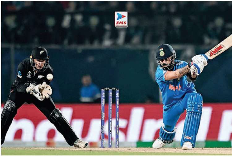
वीरेंद्र सेवण द्वारा लपक लिए गए। लोकेश राहुल को 27 रन के स्कोर पर मिचेल सेंटर में एलबीडब्ल्यू कर दिया। भारत की परी की विशेषता विराट कोहली के 95 रन रहे उन्होंने 104 गेंदों में 8 चौके और दो छक्के की सहायता से यह स्कोर बनाया। छक्का मारने के चक्कर में

धर्मशाला, एजेंसी। एकदिवसीय विश्व कप क्रिकेट के एक महत्वपूर्ण मैच में भारत ने न्यूजीलैंड को चार विकेट से पराजित कर दिया। पहले बल्लेबाजी करते हुए न्यूजीलैंड की टीम 50 ओवर में 273 रन बनाकर ऑल आउट हो गई, जिसके जवाब में भारतीय टीम ने 48 ओवर में 274 रन बनाकर न्यूजीलैंड पर जीत हासिल की। विश्व कप में भारत ने 20 साल बाद न्यूजीलैंड पर जीत हासिल की है।