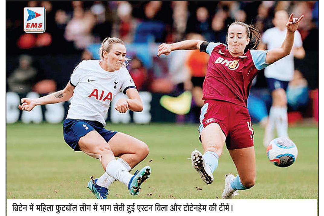
ब्रिटेन में महिला फुटबॉल लीग में भाग लेती हुई एस्टन विला और टोटेनहम की टीमों।