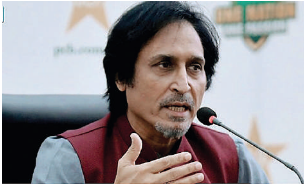
लाहौर, एजेंसी। विश्वकप में पाकिस्तान टीम के लिए इस बार विश्वकप में सेमीफाइनल की राह कठिन होती जा रही है। पाक को भारत से हार के बाद ऑस्ट्रेलिया से भी हार का सामना करना पड़ा है। इसी को लेकर अब टीम की आलोचना भी शुरू हो गयी है। पाक टीम को सोमवार को अफगानिस्तान से चेन्नई में खेलना है। इस मैच में भी पूर्व कप्तान रमीज राजा ने टीम की हार की आशंकाएं जतायी हैं। आंकड़ों के लिहाज से टीम को

भले ही अफगानिस्तान पर भारी माना जा रहा हो पर रमीज का मानना है कि चेपाक की स्पिन की सहायक पिच पर अफगान स्पिनर हावी हो सकते हैं।